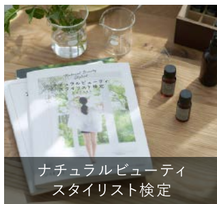
ナチュラルビューティ スタイリスト検定

植物のチカラを学び、旬の野菜やハーブ、睡眠や呼吸法などのカラダの内側からのケア、スキンケアやヘアケアなどカラダの外側からのケアに取り入れて、美しく健康的に輝く人を目指すための検定です。