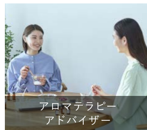
アロマセラピー アドバイザー

精油の安全な使い方、アロマセラピーに関連する法律などの知識をもち、日常生活でのアロマ活用法を提案できる能力を認定する資格です。