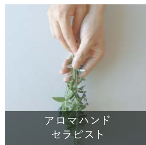
アロマハンド セラピスト

安全にアロマセラピーを行うための知識を持ち、第三者にアロマハンドトリートメントを提供できる能力を認定する資格です。