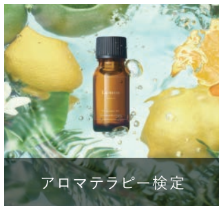
アロマセラピー検定

精油の安全な使い方、香りが心身に影響を及ぼすメカニズム、精油のプロフィールなど、多方面からアロマセラピーについて学び、役立てるための検定です。