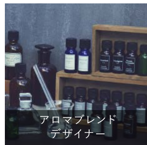
アロマブレンド デザイナー

精油を組み合わせることで、さまざまなシーンや目的に合ったオリジナルの香りを創作することができる能力を認定する資格です。