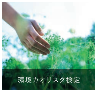
環境カオリスタ検定

植物とその香りの恵み、地球が抱えている諸問題、その解決に向けてのSDGsの取り組み、豊かな地球環境を未来に引き継ぐための身近なエコアクションについて学ぶことができる検定です。