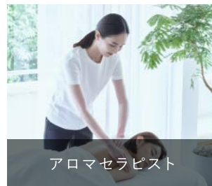
アロマセラピスト

技術と精油の専門知識をもち、心身の状態に合わせてアロマセラピートリートメントを提供できるエキスパートであることを認定する資格です。