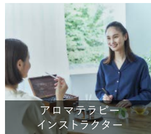
アロマセラピー インストラクター

アロマセラピーと健康に関する幅広い知識を備え、体調やお悩みに合わせたアロマの提案ができるスペシャリストであることを認定する資格です。