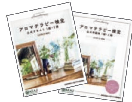
※アロマテラピー検定 公式テキストのイメージ