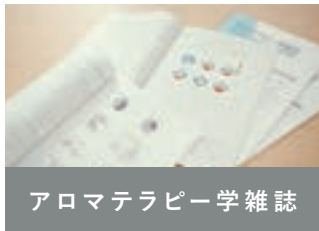
アロマテラピー学雑誌