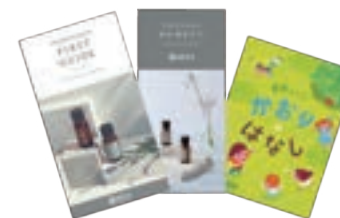
※パンフレットイメージ