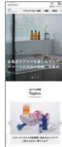
※『sense of AROMA』 のイメージ