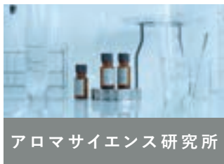
アロマサイエンス研究所