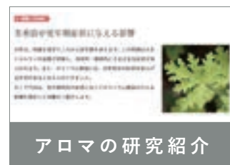
アロマの研究紹介