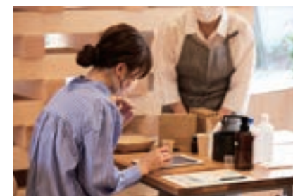
※イベントのイメージ